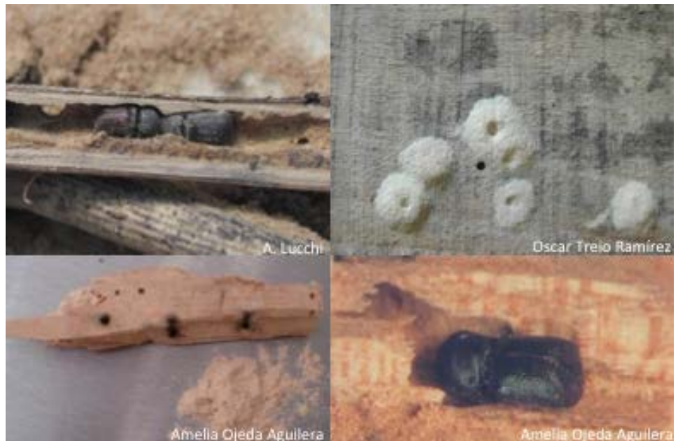
Daños producidos por adultos y larvas de Sinoxylon spp., en madera.