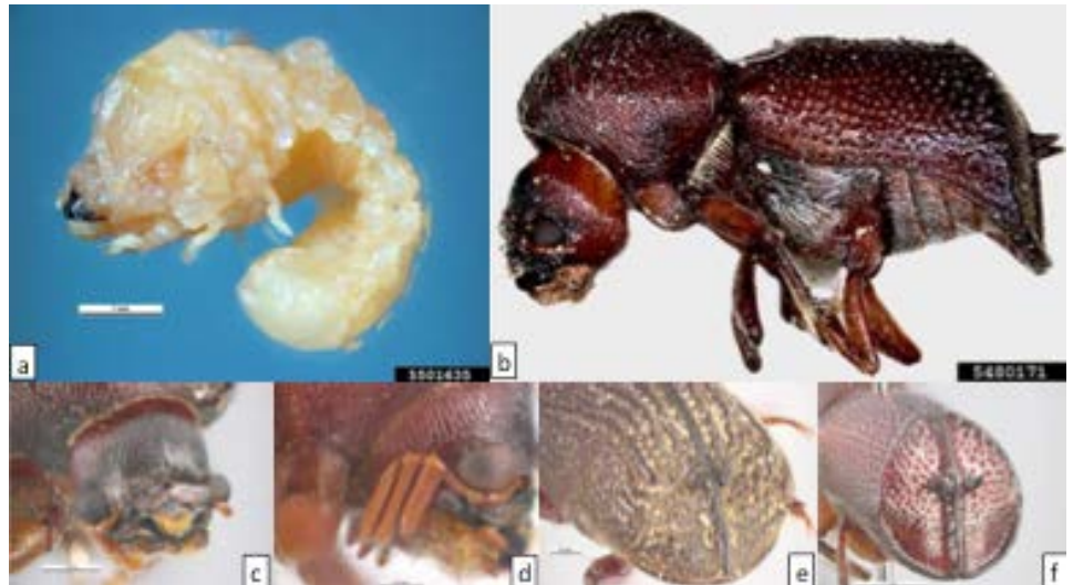
Características morfológicas de Sinoxylon spp.: a. Larva, b. adulto especie, c. cabeza convexa y ojos ovales proyectados, d. antena lobulada de 10 segmentos, e. declive elitral convexo con dos espinas, f. declive elitral cóncavo con dos espinas.

SEMARNAT, 2010. Secretaría del Medio Ambiente y Recursos Naturales. Dirección de salud forestal y conservación de recursos genéticos. Coyoacán, México, D.F. Ficha Técnica Sinoxylon anale Lesne.